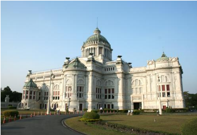
พระที่นั่งอนันตสมาคม