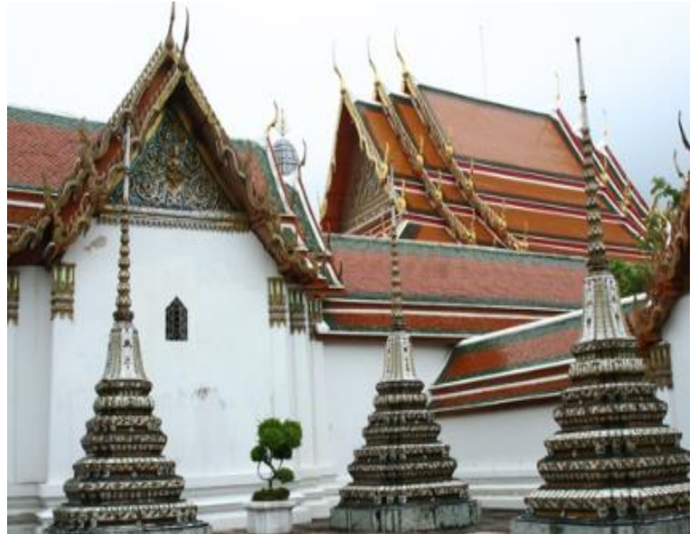
วัดพระเชตุพนวิมลมังคลาราม ราชวรมหาวิหาร